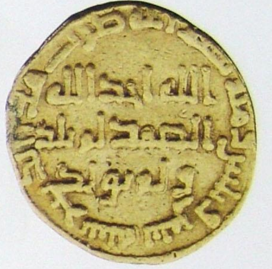
دينار أموي مروان بن محمد سنة: ١٣٢ هجري